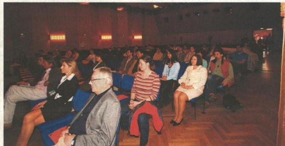
Im gediegene Ambiente des Maritim Hotels geht es am Wochenende um die Gesundheit.

Jede Zeit hat ihre gesundheitlichen Herausforderungen. Waren es früher z. B. Infektionskrankheiten, so sind es heutzutage, im Zeitalter von Hektik und Stress, u. a. Krebs, Herz-Kreislauf-Erkrankungen und Burnout. Kaum jemand nimmt sich genügend Zeit, über seinen Lebensstil und seine Lebensart nachzudenken. Viel eher greift man schnell zu Medikamenten, um die Symptome zu unterdrücken. Mit unserem Forum wollen wir den