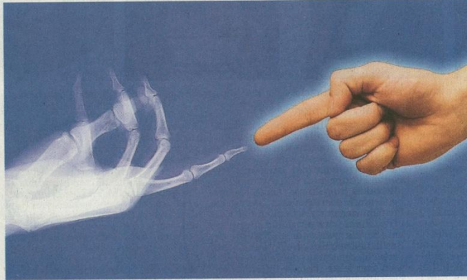
Ein Symbolbild für die Aktivitäten auf dem 4. Gesundheits-, Wellness- und Medizinforum, das am kommenden Wochenende im Maritim Hotel stattfindet.

Neben den Vorträgen warten auf die Besucher Workshops und eine Fachausstellung. Dort präsentieren sich Therapeuten, Reha-Kliniken, Sportzentren, Produzenten von Bio-Produkten und Diät-Artikeln, Ernährungsberater, Ärzte mit ganzheitlichem Ansatz und Gesundheitszen-